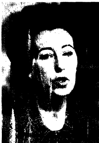
Letizia Moratti