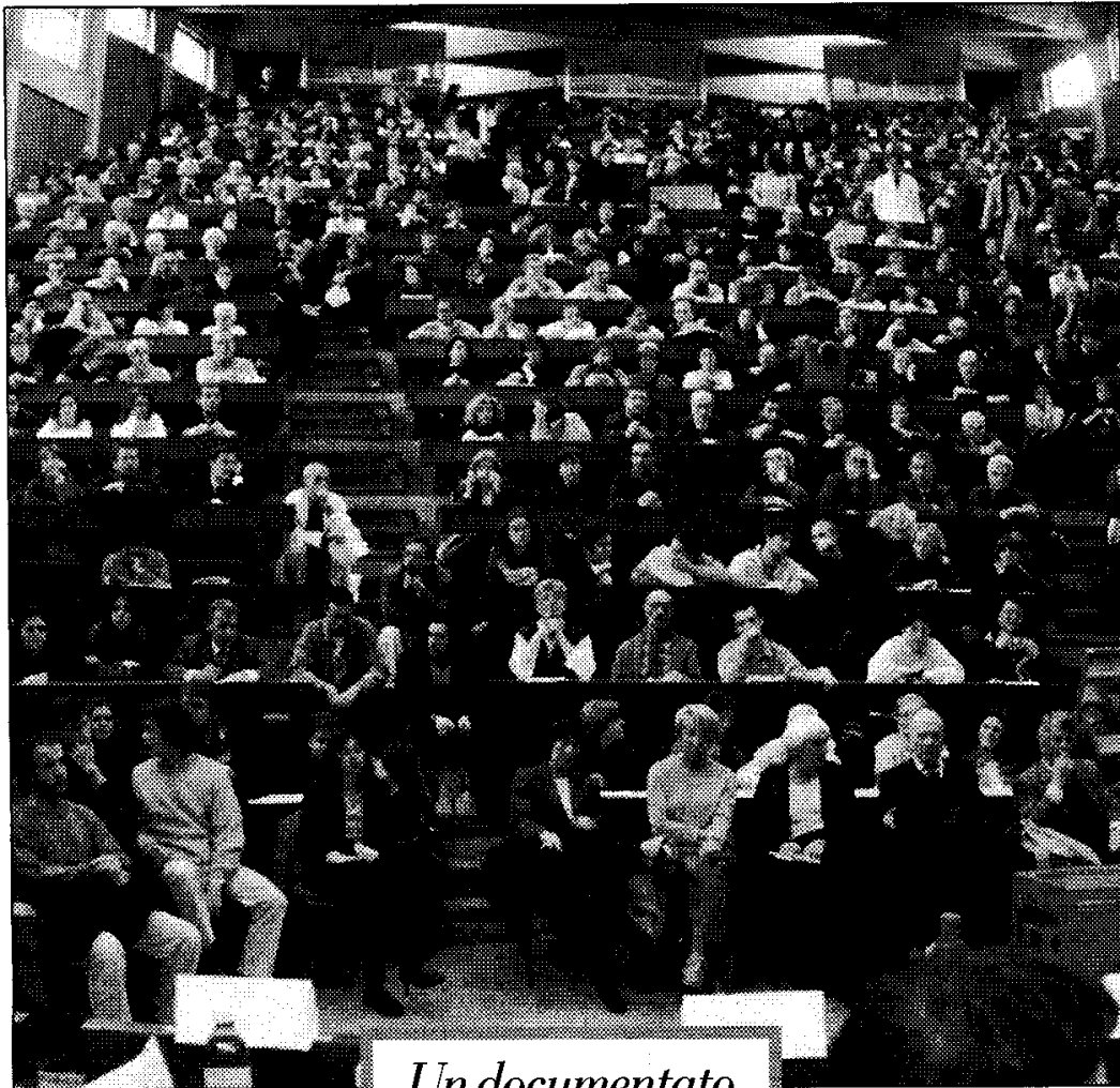
L'Aula Magna dell'Università di Genova

Non più «formazione della personalità», non più «autovalorizzazione personale», come Pier Aldo Rovatti chiama la motivazione che spinge un giovane a iscriversi all'università, non più riconoscimento e autoriconoscimento come avveniva nelle lezioni (non tutte inutili), nei colloqui d'esame (non tutti frustranti, oggi sostituiti da anonime prove scritte), nella tesi di laurea che, se anche non letta da tutti i componenti la commissione, era pur sempre un tempo dove lo studente gettava la maschera e si metteva in discussione, perché per la prima volta era di fronte a se stesso a dimostrare,